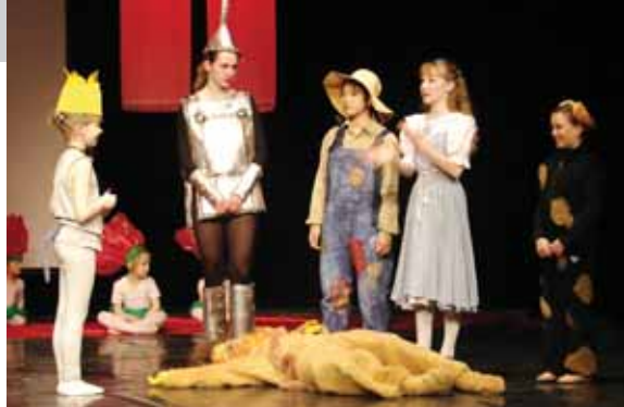
Szene aus dem Tanztheater „Zauberer von Oz“

Nach dem erfolgreichen letzten Jahr startet die Kunstschule Norden (KSN) ins neue Programm 2011/2012. Unser bereichsübergreifendes Projekt „Der Zauberer von Oz“ in dem unsere Abteilungen Ballett und Bildende Kunst im Frühjahr dieses Jahres zusammengearbeitet haben, hat gezeigt, dass viele kreative Menschen in der KSN tätig sind. Um so große Projekte zu bewerkstelligen, sind helfende Hände und gesicherte finanzielle Mittel sehr wichtig.